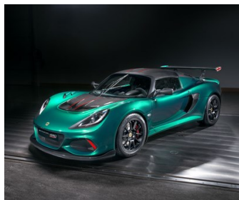
LOTUS EXIGE CUP 430