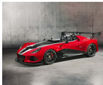
NOVÝ LOTUS 3-ELEVEN 430